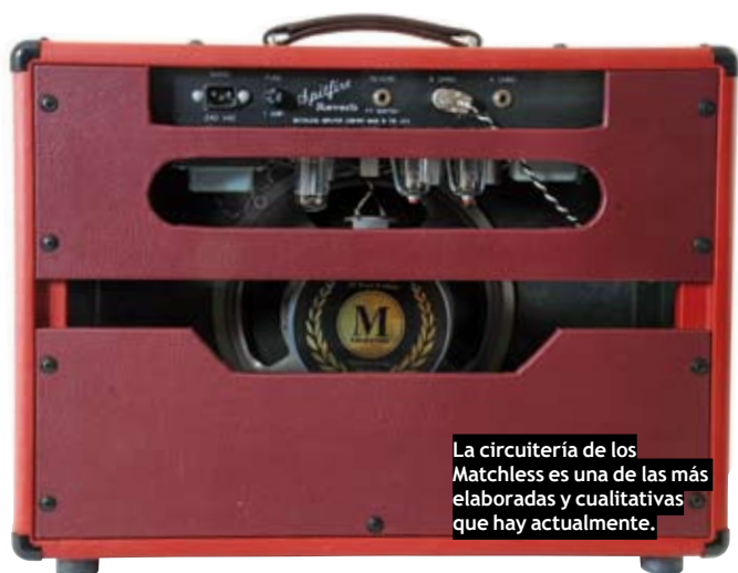
La circuitería de los Matchless es una de las más elaboradas y cualitativas que hay actualmente.

Eso sí, decir que la saturación que nos ofrece es de baja