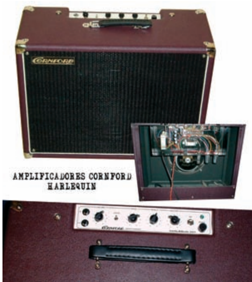
AMPLIFICADORES CORNFORD HARLEQUIN

Éste es el amplificador actualmente más solicitado por los estudios de grabación; su principal característica es el grosor de su sonido, así como su definición. Igualmente tiene un característico sonido lleno de personalidad y en las grabaciones pondrá siempre las guitarras en primer plano. Desde el Black is Black de AC/DC, pasando por Van Halen hasta el más puro sonido Blues. Igualmente recortando la ganancia conseguiremos un sonido Jazz, así como un sonido a lo British Pop. La principal ventaja de este amplificador es que puedes poner su etapa de potencia a tope de volumen, por lo que consigues esa característica saturación tan rica de las válvulas de etapa. Por este motivo es el favorito de guitarristas de lujo como Guthrie Govan y otra gente de la revista Guitar Technic, Guitarrista, etc. Así como innumerables estudios de grabación de España y de todo el mundo. A destacar ese tono mordiente, grueso, que lo hace tan distinto que no querrás volver a grabar con otro amplificador.