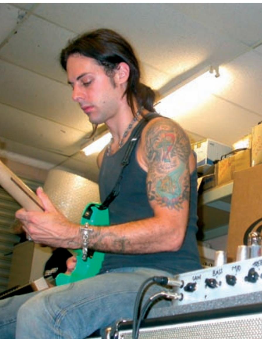
Richie Kotzen probando el prototipo de su modelo signature